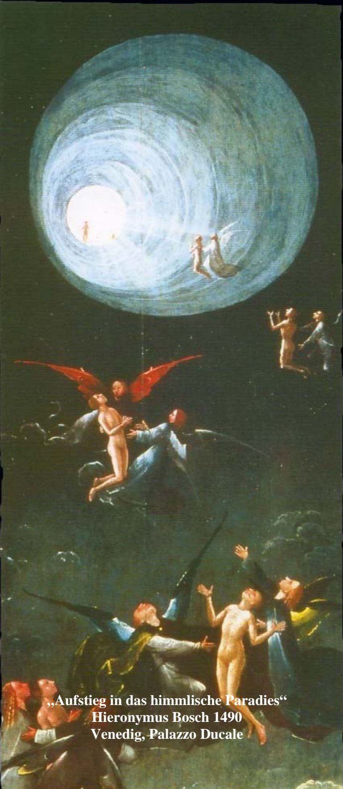
„Aufstieg in das himmlische Paradies“ Hieronymus Bosch 1490 Venedig, Palazzo Ducale