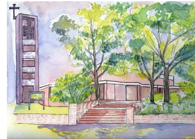
Dürthe Reher, „Kirche Zum Guten Hirten im Sommer“